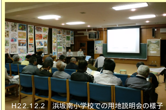
H22.12.2 浜坂南小学校での用地説明会の様子

浜坂道路については、日頃から各地区の区長・役員のみなさんをはじめ地域の方々に、よく話し合いをしていただいていたこともあり、多くの方々のご理解を得て、順調に用地買収の事務手続きを進めています。関係のみなさまに厚くお礼申し上げます。