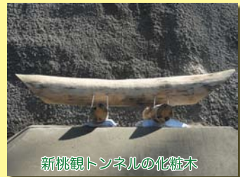
新桃観トンネルの化粧木

工事中のトンネルの坑口(入り口)の上部には、化粧木(けしょうぎ)という飾りが置かれています。山の神様(女性だそう)に対する信仰と工事の安全を祈願するためのもので、現在もほとんどのトンネルの工事現場で見ることができます。化粧木は神社の鳥居が由来で、山の神がいる神聖な領域への入り口を示しているそうです。化粧木は、固くて生命力に溢れる反りのある木が理想的とされ、長さ三尺六寸五分(約1.2m)のマツやヒノキの丸太材を磨き、両端を角のように加工して置かれます。