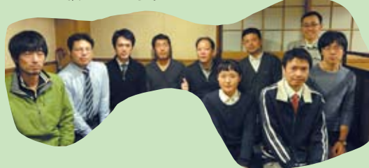
浜坂道路担当職員一同

今後も浜坂道路の一日でも早い開通を実現するため努力してまいります。今後ともよろしくをお願いします。