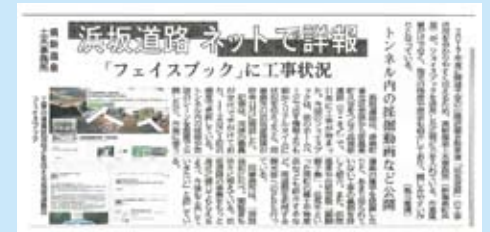
平成26年2月13日の神戸新聞の記事

浜坂道路公式のフェイスブックページが2月13日の神戸新聞で紹介されました。昨年11月に開設し、地道に情報発信を続けていたところ、神戸新聞の記者の目に留まり記事にして頂きました。新聞の反響は大きく、2月25日（火）には「いいね」の数が100を突破しました。これからも、『浜坂道路ファン』の皆様に楽しんで頂けるような情報発信に努めてまいります。まだ見たことのない方は、ぜひ一度ご覧になってください。