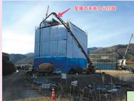
この部分を施工しています

大庭大橋は左右のバランスを取りながら、数メートルのブロックに分けてコンクリートを打設し「やじろべえ」のように張り出しながら橋をつくります。写真は、最初に行う柱頭部（橋脚と橋桁が結合する部分）の施工状況です。コンクリートの品質を高めるため、冬は足場全体をシートで覆って外気を遮断しています。