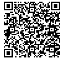
発熱時相談チェックシート 説明動画