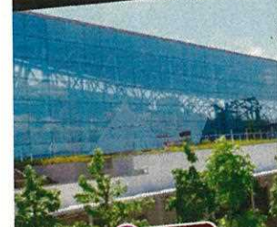
3 亀岡市 生涯学習施設 道の駅 ガレリアかめおか 亀岡ICから2km