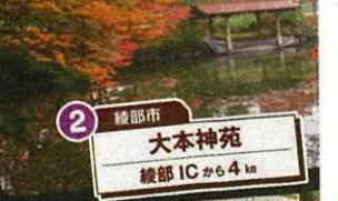
2 綾部市 大本神苑 綾部ICから4km