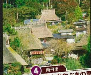
4 南丹市 美山かやぶきの里 園部ICから33km