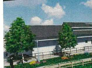
8 福知山市 福知山鉄道館フクレル 福知山ICから5km