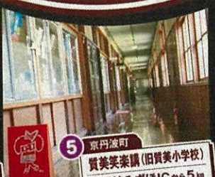
5 京丹波町 賢美美楽園(旧賢美小学校) 京丹波みずほICから5km