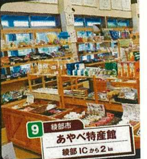
9 綾部市 あやべ特産館 綾部ICから2km