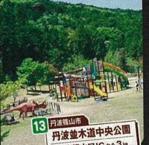
13 丹波篠山市 丹波並木道中央公園 丹南篠山ICから3km