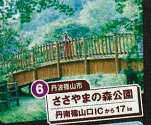
6 丹波篠山市 ささやまの森公園 丹南篠山ICから17km