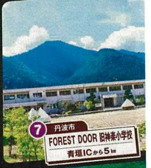
7 丹波市 FOREST DOOR 旧神楽小学校 青垣ICから5km