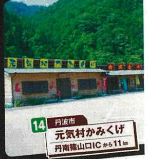
14 丹波市 元気村かみくげ 丹南篠山ICから11km