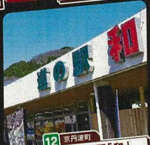
12 京丹波町 道の駅「和」 京丹波わちICから7km