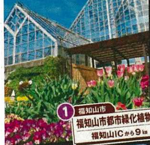
1 福知山市 福知山市都市緑化植物園 福知山ICから9km