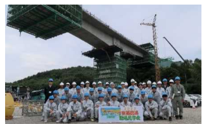
東播磨道(北工区)室山高架橋見学