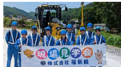
(主)西脇篠山線 ICT 舗装工見学