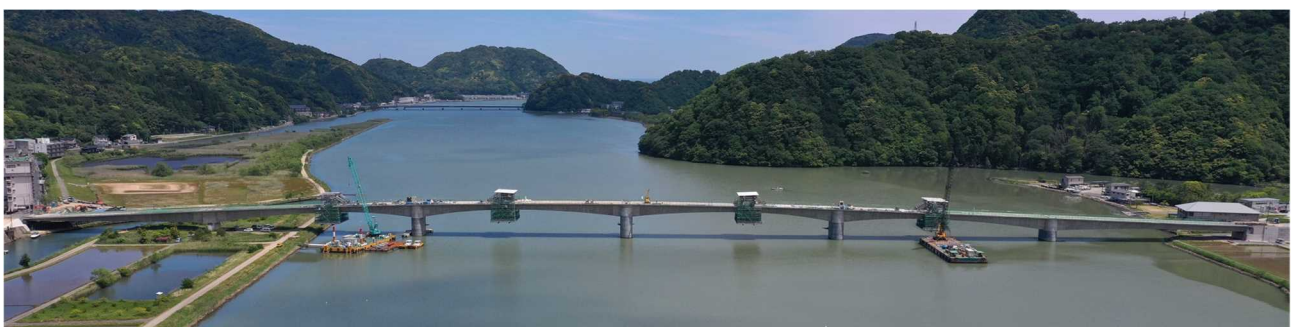
(主)豊岡竹野線(仮称)城崎大橋 橋梁上部工事 (張出し架設工法により施工中)