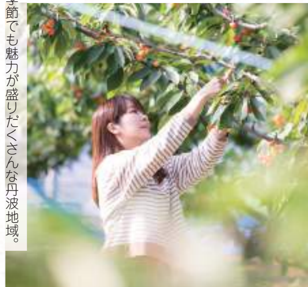
ハサミとカップを受け取りサクランボ狩りを楽しまします。脚立に上れば、上の方のサクランボも採ることができます。