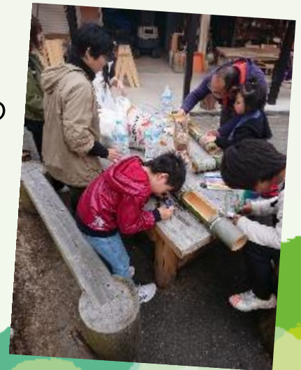
竹ごはんの器を作製中