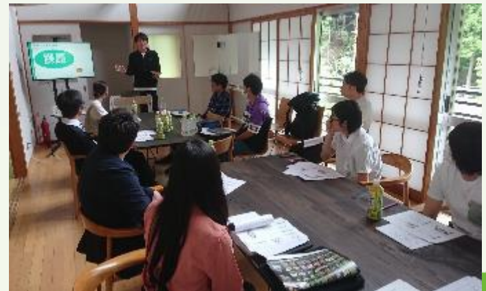
オリエンテーションの様子