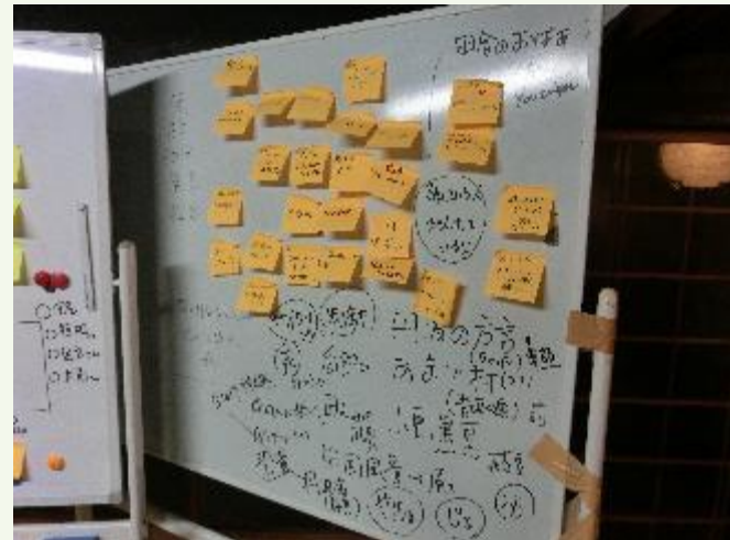
ユースチームからのアイデア