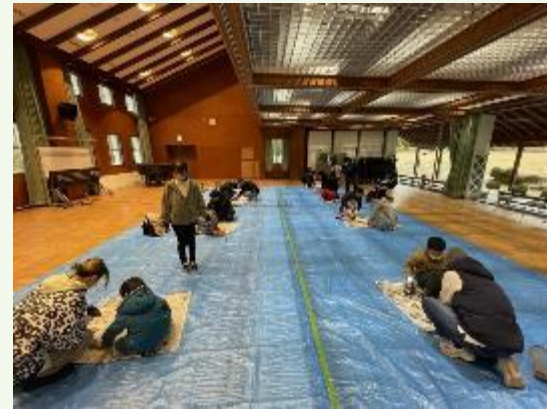
竹ランタン制作会場の様子