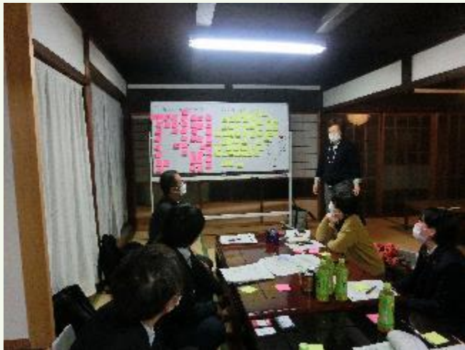
ヒアリングの様子