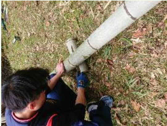
竹を切るメンバー