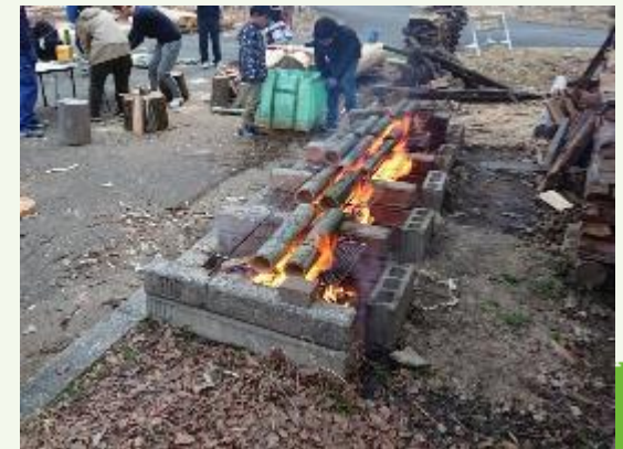
竹ごはん炊き出し