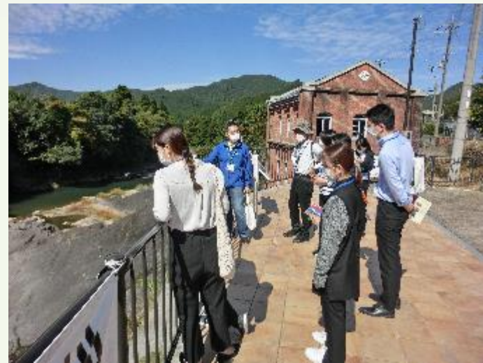
現地ヒアリング調査