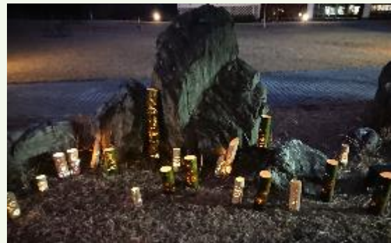
竹ランタンのライトアップ