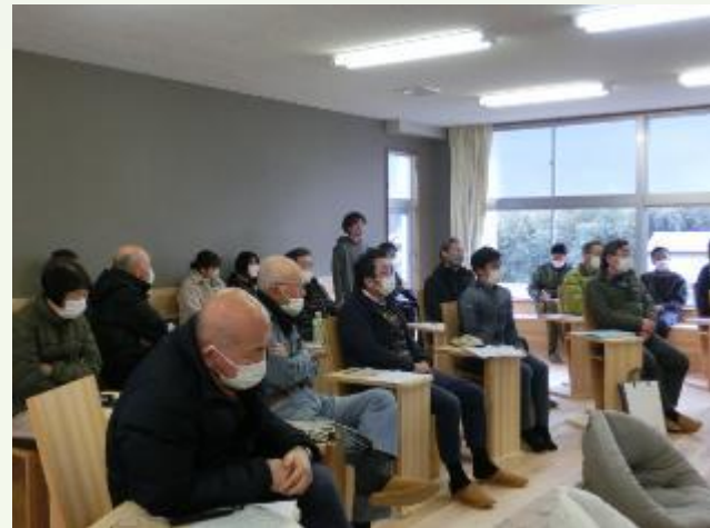
里山育成研修会で意見交換