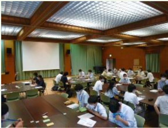
グループ活動の様子