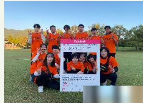
パネルで記念撮影