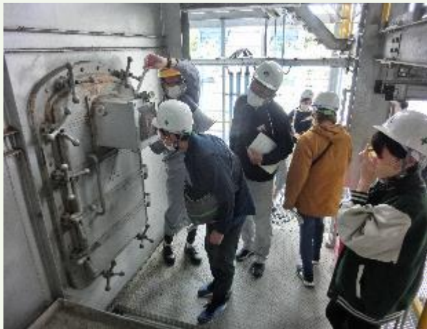
バイオマス発電施設の見学