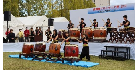
(ステージイベント)