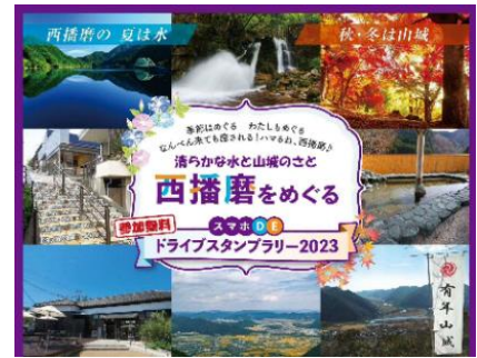
【デジタルスタンプラリー2023】