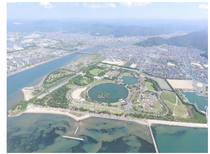
【赤穂海浜公園（全景）】

公園の更なる魅力の向上を図るため、「県立都市公園のあり方検討会」での検討結果(自然環境保全及び民間を活用した活性化のあり方)も踏まえ、引き続き「赤穂海浜公園管理運営協議会」を中心に利用促進や新たな施設整備に取り組むとともに、民間活力導入による新たなパークマネジメントの実施に向けた準備を行う。