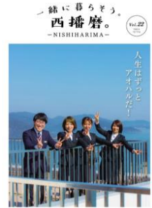
【縁結び情報フリーペーパー 「一緒に暮らそう。西播磨。」】