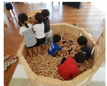
【認定こども園での木育活動（たつの市）】