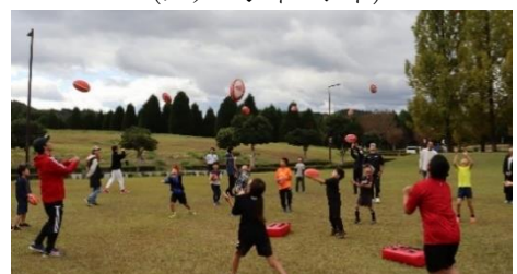
【西播磨フロンティア祭2023】(コベルコ神戸スティーラーズラグビー教室)