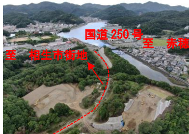
【竜泉那波線の整備状況】