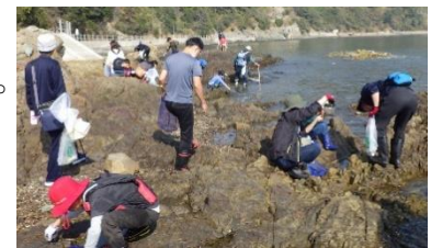
【エコツアーでの磯の生き物観察 & クリーン作戦（赤穂市）】