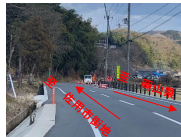
【上福原佐用線の整備状況】