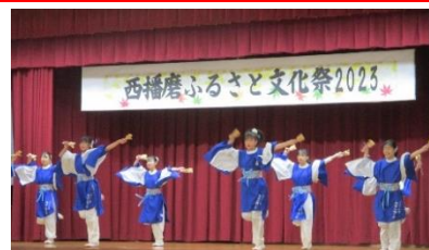
【西播磨ふるさと文化祭 2023（西播磨文化会館）】