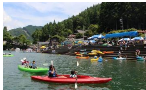
【音水湖（宍粟市）のカヌー】