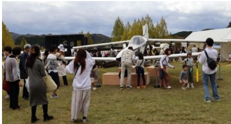
(空飛ぶクルマの展示)