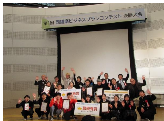
【2023 西播磨ビジネスプランコンテスト】