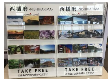
【観光カード (24 種類) 配架】