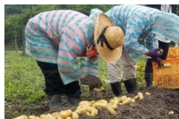
【農福連携による農作業（佐用町）】