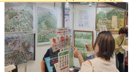
【特別版 お城 EXPO in 姫路 2023】