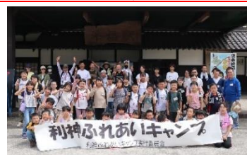
【利神ふれあいキャンプ実行委員会による利神城がトッツアー（佐用町）】