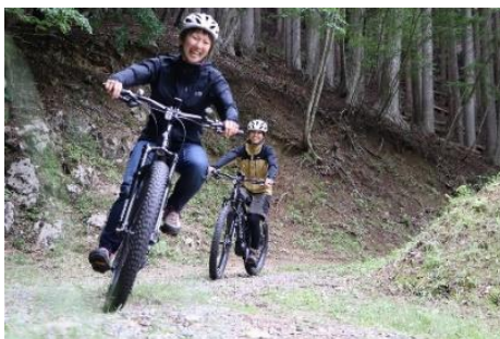
【E-BIKE（電動アシスト付きマウンテンバイク）】