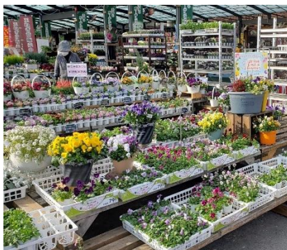
【ホームセンターでの花壇苗の販売(たつの市)】