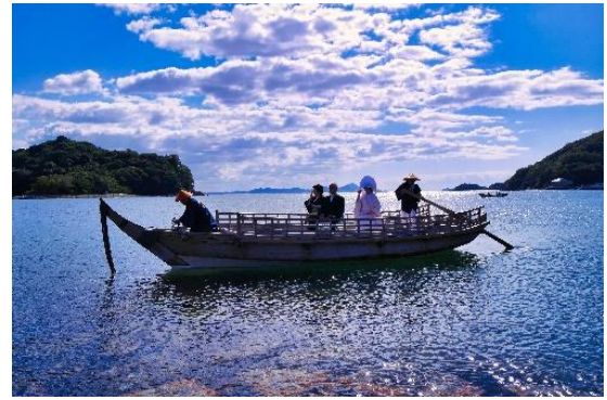
【2023 水系自慢コンテスト写真部門 最優秀賞】