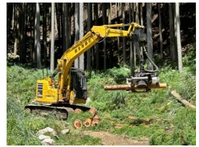
【林業体験会での機械操作体験(宍粟市)】