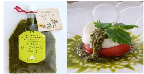
【2023 グランプリ 「なべしまファーム」の「みつ葉のジェノベーゼソース」(赤穂市)】