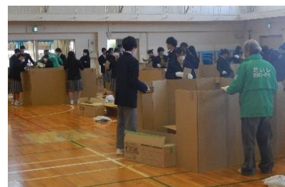
【防災教育出前講座（太子高校）】