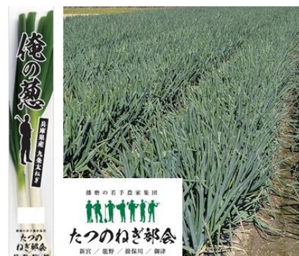
【ブランド化を進める「俺の葱」(たつの市)】