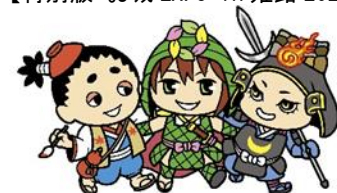
【西播磨の山城3兄弟】