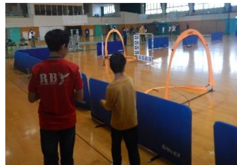
【西播磨ドローンレース大会 (佐用町立上月体育館)】