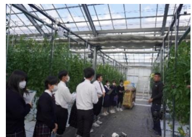
【農業高校生対象の農園見学ツアー(宍粟市)】