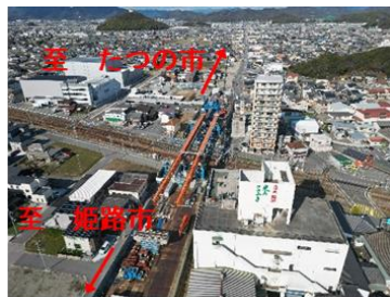
【太子御津線の整備状況】