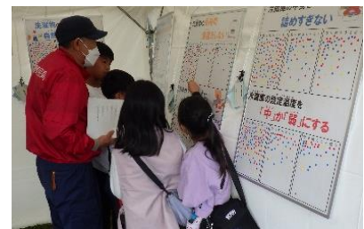
【西播磨エコフェスでの脱炭素行動人気投票】