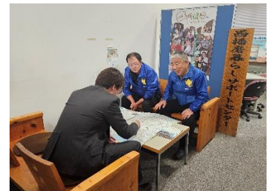
【移住コーディネーターによる相談対応】