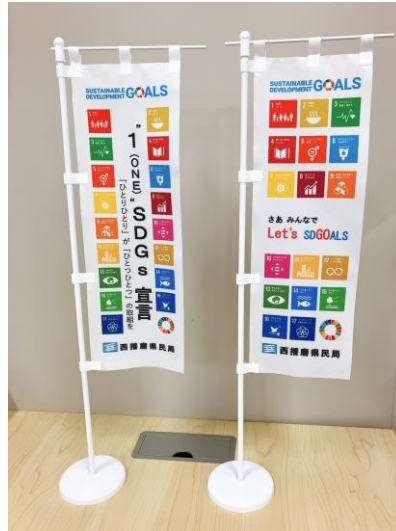
受付スペース (卓上のぼり)