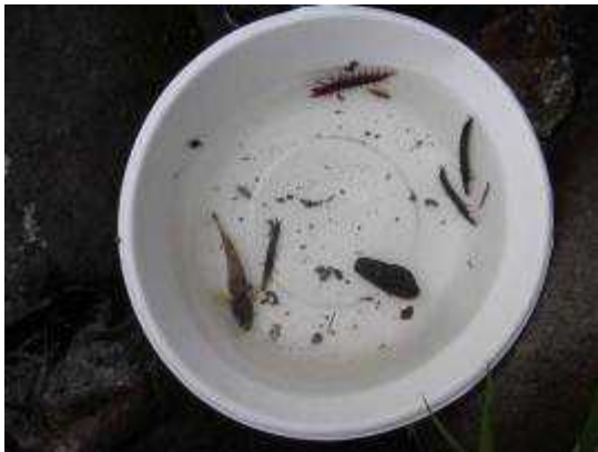
← 採集した水生生物