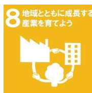
西播磨地域ビジョン 2050 取組目標