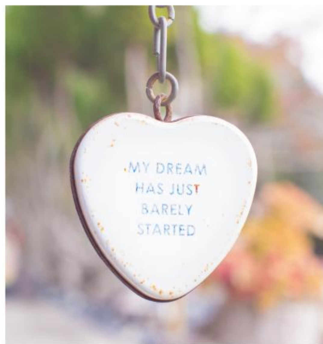
写真撮影は恋人たちが飾り付けた南京錠のある鎖の前で行いました。

このコーナーでは 出会いや結婚を応援する 西播磨結婚応援企業を ご紹介しています。