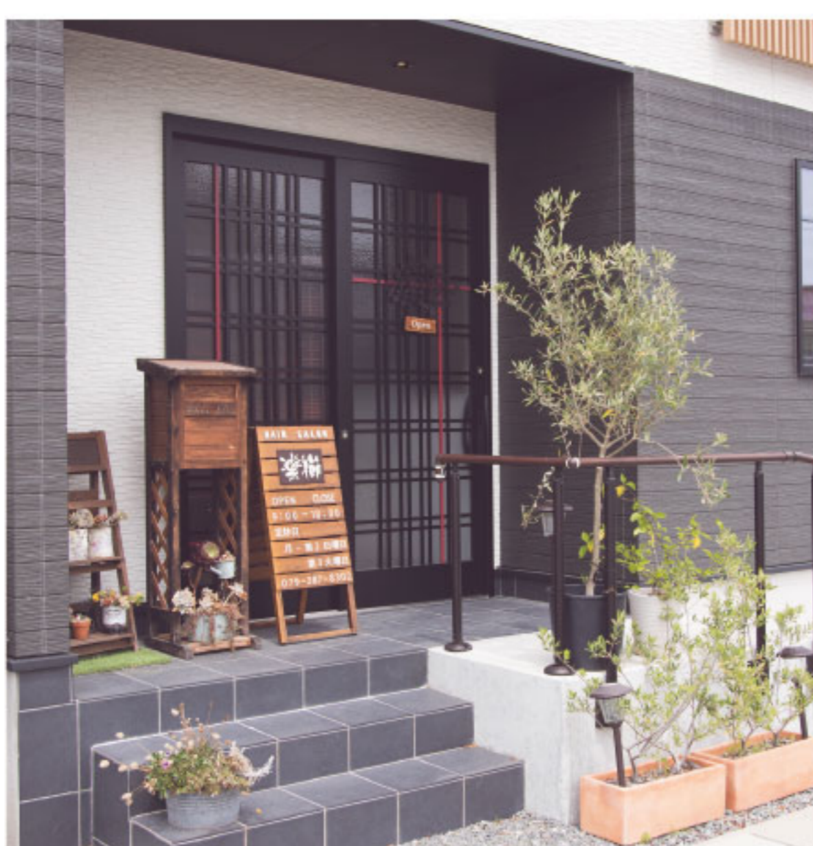
美容室 楽櫛 太子町鵜1008-8 TEL/079-287-8302 定休日/毎週月曜・第2日曜・第3火曜日