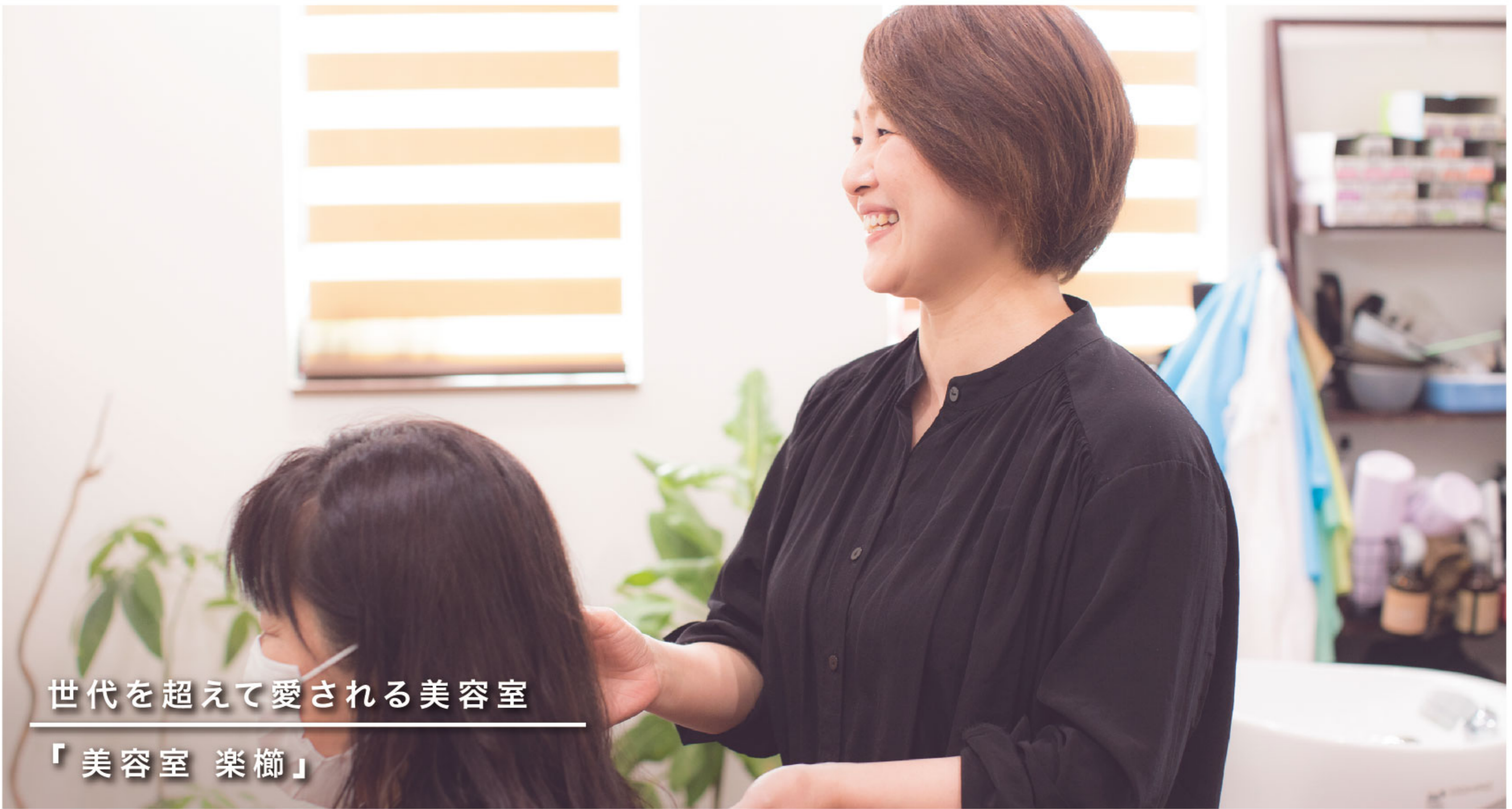
世代を超えて愛される美容室