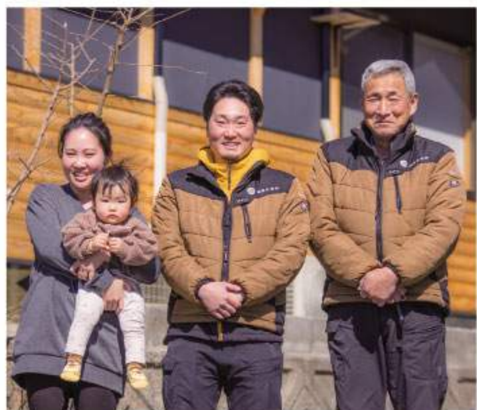
事務所には従業員のお子さんもいらっしやう、アットホームな雰囲気がありました。

多くの若いチカラを育ててきた会社には、これからも山を愛する人々が集い、その輪を広げていくことでしょう。