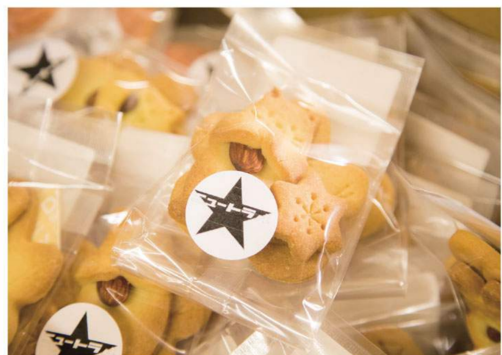
宍粟市の提携カフェや道の駅、地域のイベントでもいただけるオリジナルの焼き菓子。

カフェのオープンから三年、誕生日ケーキや百日祝いなどスイーツの注文が徐々に増え、遠方から足を運ぶ人も出てきました。一方で、イベント出店やキャンプ場開設の仕事にも携わり、さまざまな人と話す中で自然豊かな地元の魅力にハッとさせられることも。