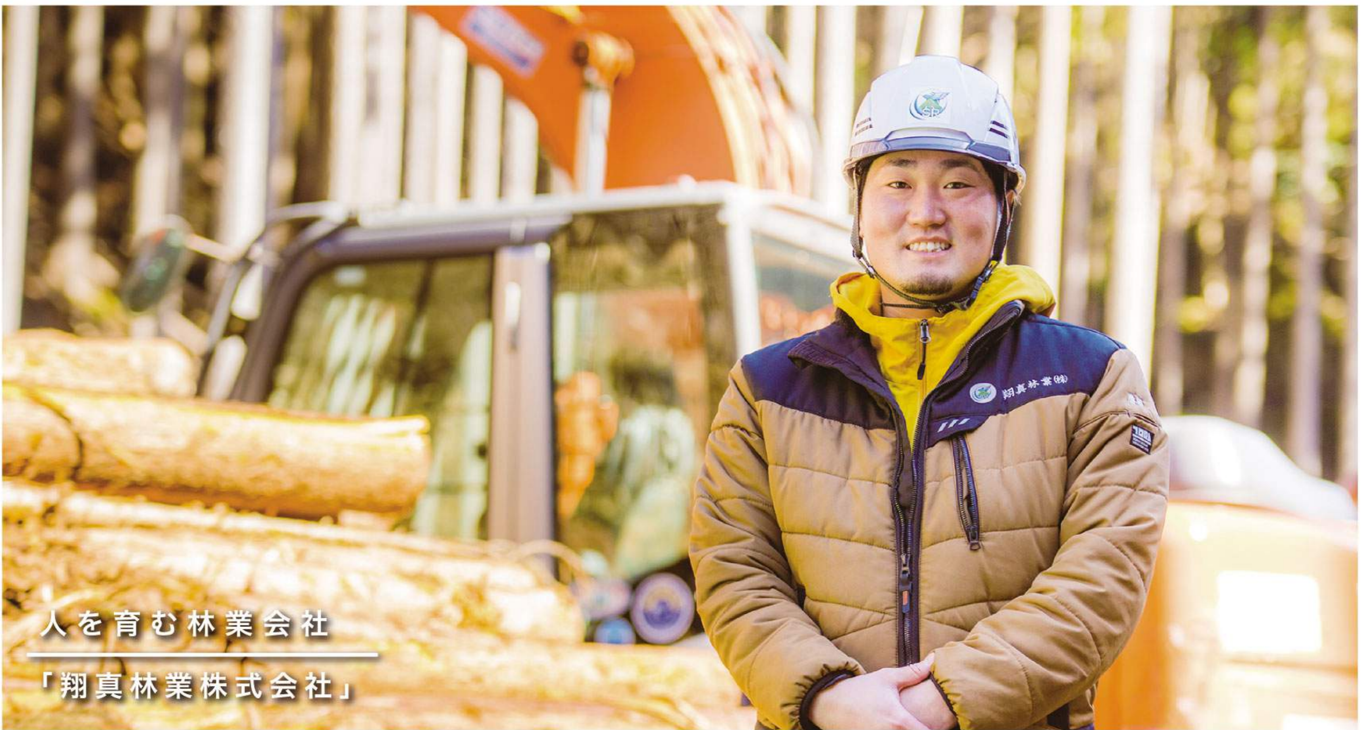
人を育む林業会社 「翔真林業株式会社」