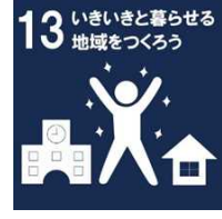
西播磨地域ビジョン2050 取組目標