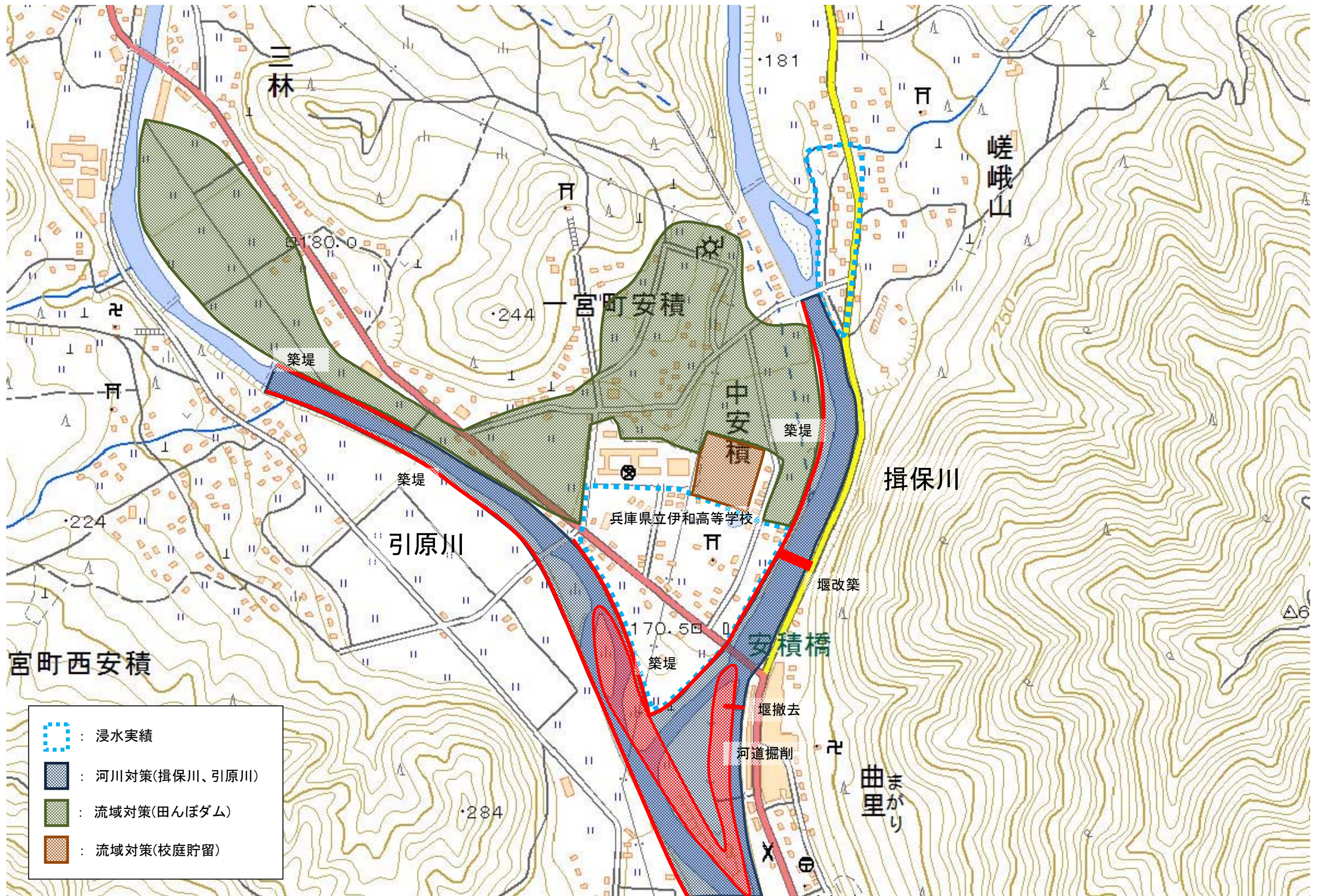
図3 宍粟市のモデル地区の概要：一宮町安住地区（イメージ図）