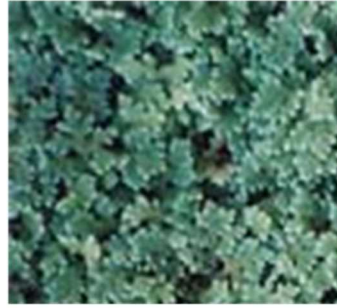
アブラ・クリスタ