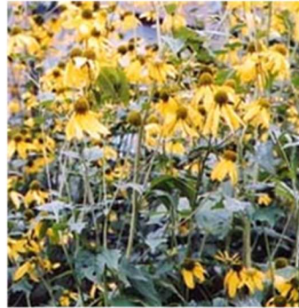
オオハンゴンソウ