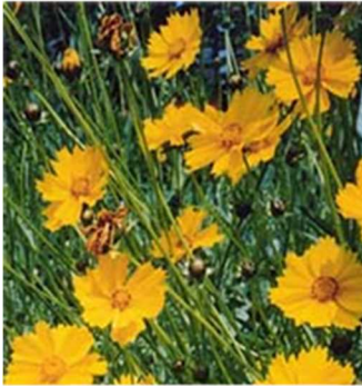
オオキンケイギク