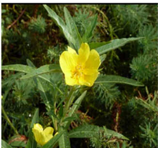
オオバナミズキンバイ