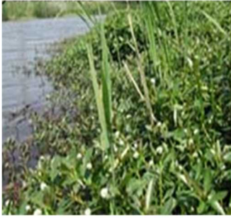
ナガエツルノゲイトウ