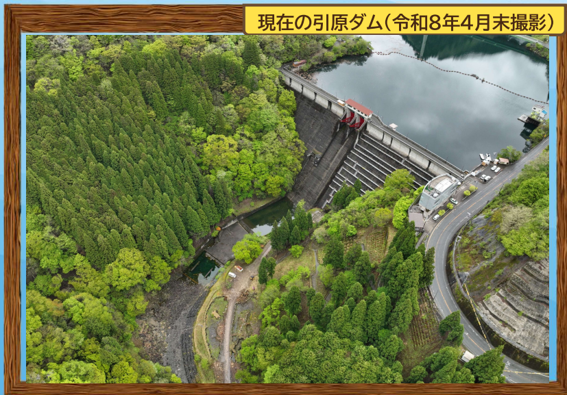
現在の引原ダム(令和8年4月末撮影)